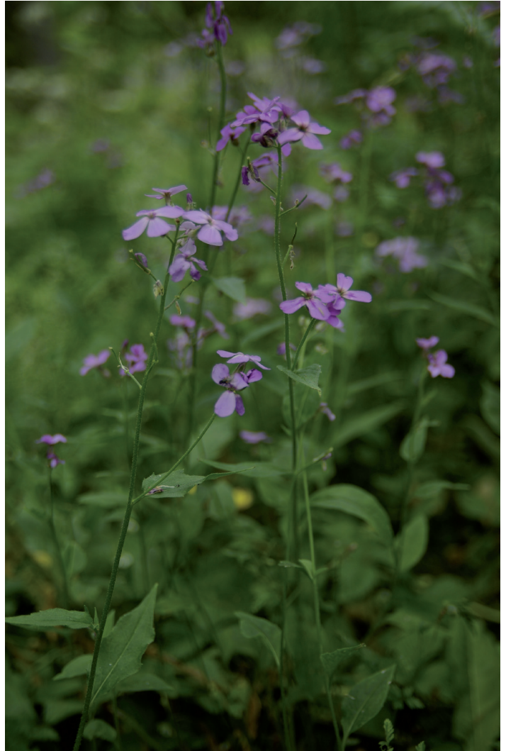
Illakko, jota on viljelty Suomessa koristekasvina yli 200 vuotta, on yleinen vieraslaji Akaassa.

Itä-Siperiasta kotoisin olevaa, etenkin pensasaitakasvina viljeltyä kiiltotuhkapensasta tavattiin 40 kohteesta. Lintujen levittämänä lajina sitä esiintyy usein melko kaukanakin pihoista ja se on yleinen erityisesti lehtipuuvaltaisissa, kuivahkoissa metsissä.