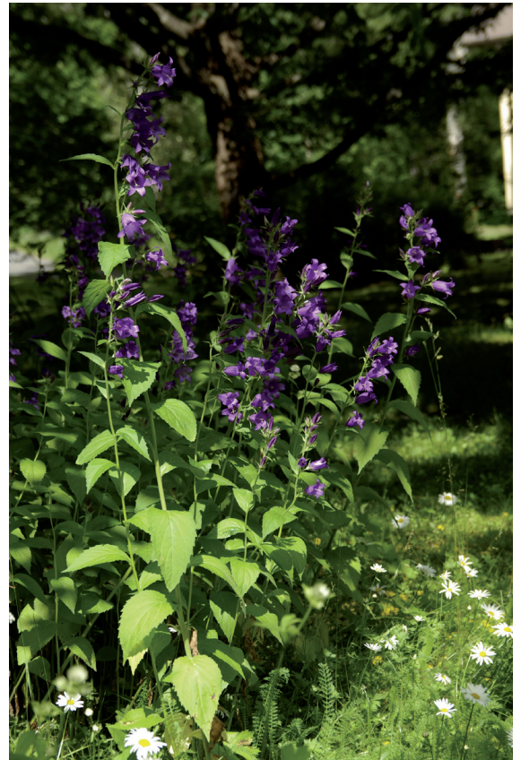
Ukonkello on kaunis, mutta helposti luontoon leviävä perenna.

Keskieuropalainen rohtosormustinkukka on vanha rohdoskasvi, jota on meillä viljelty koristekasvinakin ainakin 1800-luvun puolivälistä lähtien. Laji on kaksivuotinen. Ensimmäisenä vuotena kehittyy lehtiruusu, toisena vuotena noin metrinen kukinto ja runsaasti siemeniä, jotka säilyttävät itävyytensä maassa jopa kymmeniä vuosia (Alanko & Kahila 2005). Laji on ilmaston leudontumisen myötä selvästi yleistynyt alueella.