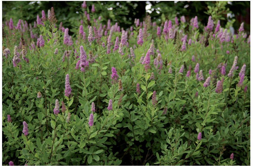
Rusopajuangervo on vanhimpia koristepensaitamme. Voimakkaan juuristonsa avulla se voi muodostaa tiiviitä ja laajoja kasvustoja.

Rusopajuangervoa tavattiin 36 kohteesta, useimmista pieninä tai pienehköinä kasvustoina; varjoisat taajamametsät eivät ole sille erityisen otollisia elinympäristöjä. Toijalan Lastumäen entisellä ratapengerryksellä (40 b) on muutamia lajin kasvustoja, joista suurin on noin 300m 2 . Samoin Viialan Lallinhetteikössä (82) on suuri, noin 400m 2 :n kasvusto.