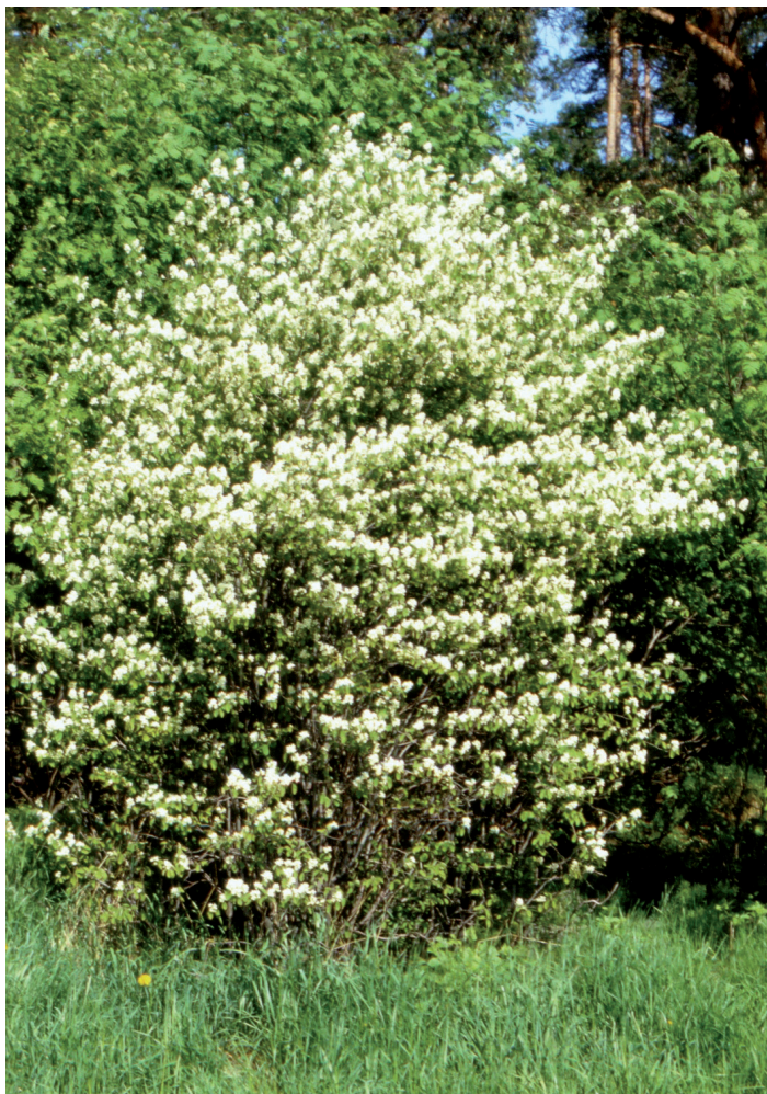
Isotuomipihlaja kukkii toukokuun lopulla.