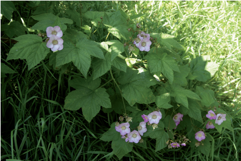
Tuoksuvatukka on kauniskukkainen, mutta juuristonsa avulla helposti leviävä ja hankalasti torjuttava koristepensas. Laji on viime vuosina levinnyt monin paikoin myös Akaan puistometsiin.

Pohjois-Amerikan itäosista kotoisin oleva tuoksuvatukka on ollut suosittu koristepensas ainakin 1960-luvulta lähtien. Se leviää tehokkaasti juuriversojensa avulla ja muodostaa sopivilla puoliavoimilla paikoilla laajoja, yhtenäisiä kasvustoja. Marjoja ja siemeniä tuoksuvatukka tekee meillä harvoin ja niukasti.