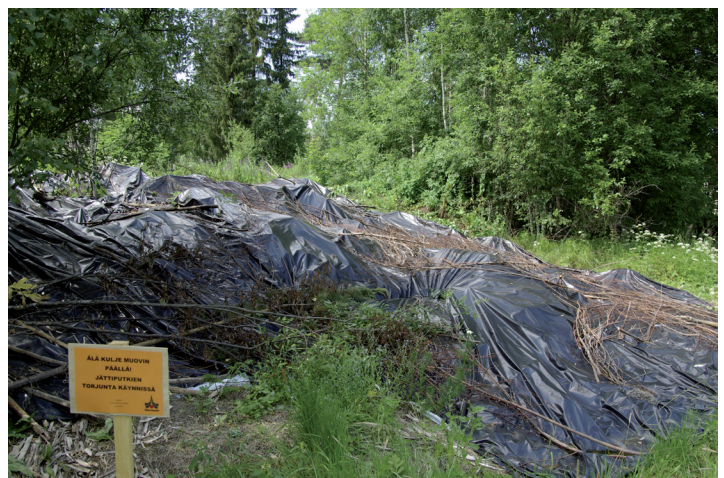
Joissakin tilanteissa vieraslajin torjunnassa voidaan käyttää muovikatetta, jonka pitäisi kuitenkin kestää useita vuosia. Jättiputken torjuntaa Toijalan Kurkelassa 2014.