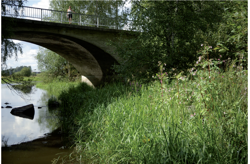
Jättipalsamia ja isosorsimoa Kylmäkoskella. Taustalla Tarpianjoen silta.

Jättipalsami ei ole Akaassa erityisen yleinen ja laajalti levinnyt, mutta koska lajin kasvupaikoiksi sopivia ranta-alueita on alueella paljon, lajin torjuntaan tulisi kiinnittää erityistä huomiota.