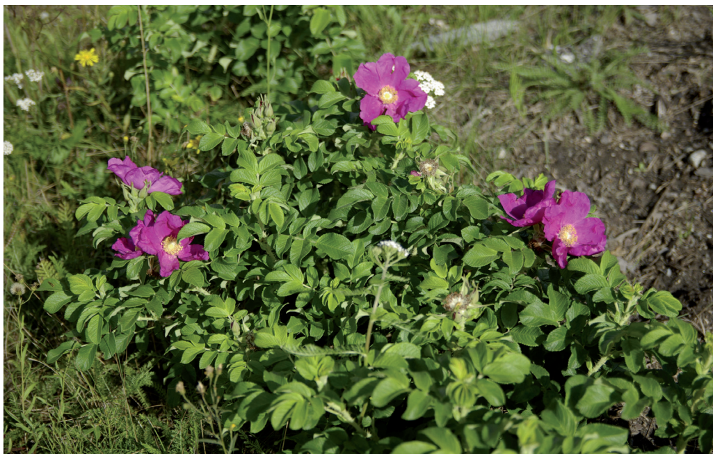
Kurtturuusu on luokiteltu haitalliseksi vieraslajiksi. Akaassa sitä kasvaa kuitenkin lähinnä katujen ja teiden pientareilla.

Näistä istutuksista se on liikenteen ja lintujen mukana levinnyt laajalti katujen ja teiden varsille sekä muille avoimille, soraisille paikoille, mutta myös Vanajaveden kallioisille saarille ja rannoille. Varjostusta kurtturuusu sietää huonosti, eikä se siksi viihdy metsissä. Lajia tavattiin viidestä kohteesta, joissa sen kasvustot olivat poikkeuksetta vähäisiä ja sijaitsivat taajamametsien reuna-alueilla.