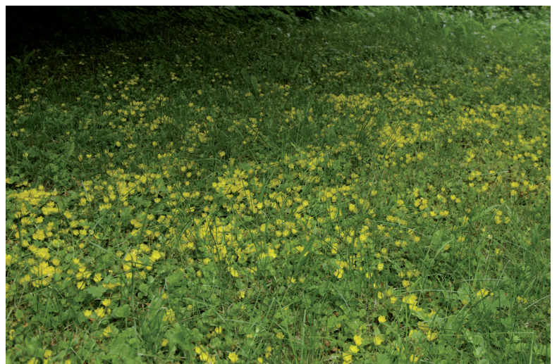
Suikeroalpi leviää usein haravointi- ym. puutarhajätteiden mukana lähiluontoon.

Inventoinnissa suikeroalpi löytyi 19 kohteesta, useimmiten tonttien rajoilta sekä uusien ja vanhojen puutarhajättekasojen läheisyydestä.