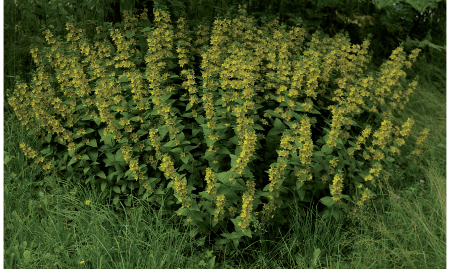
Tarha-alpi on suosittu monivuotiskukka eli perenna, joka leviää tehokkaasti kasvullisesti.

Keski-Euroopasta kotoisin oleva tarha-alpi on 1950-luvulta lähtien Suomessa hyvin yleisesti viljelty, noin metrin korkuiseksi kasvava monivuotiskukka. Laji leviää erityisesti kasvullisesti juuriversojen avulla. Tarha-alpi tavattiin 22 kohteesta, tyypillisesti tonttien rajoilta sekä puutarhajättekasojen läheisyydestä.