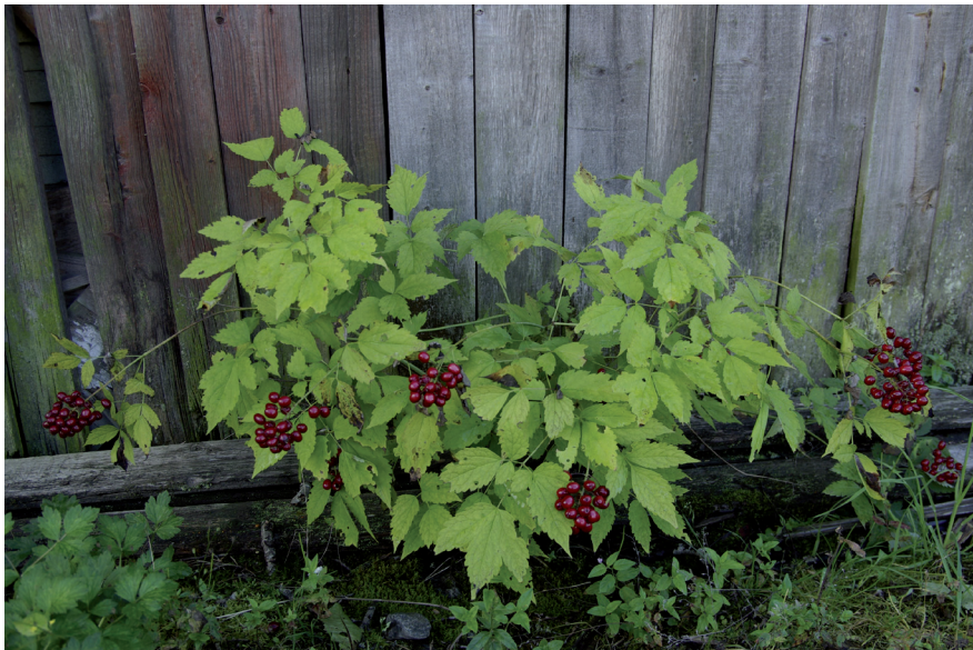
Lännekonnamarja on meillä harvinainen koristekasvi, joka voi kuitenkin paikallisesti, kuten Viialan Lallinmäen rannassa, levitä nopeasti siemenistä.

Eräät yksittäisistä kohteista tavatut lajit, kuten lännenkonnamarja ( Actaea rubra ; 82 ja 83a), siperianorapihlaja ( Crataegus sanguinea ; 1), isohirvenjuuri ( Inula helenium ; 74), valkotäpläimikkä ( Pulmonaria saccharata ; 67), orapaatsama ( Rhamnus cathartica ; 18 ja 44b), neuvoksenruusu ( Rosa x spaethiana ; 20), skopolia ( Scopolia carniolica ; 73, 90 ja 91) ja kaljupajuangervo ( Spiraea alba var. latifolia ; 71), ovat meillä pitkään, mutta harvinaisina viljeltyjä koristekasveja. Niiden esiintymillä saattaa olla merkitystä esimerkiksi lisäysmateriaalia tarvittaessa.